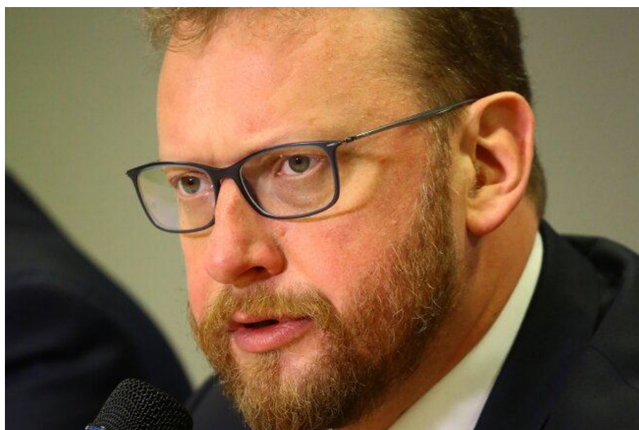
Minister zdrowia Łukasz Szumowski.

Trzeba patrzeć na badania kliniczne nie tylko z perspektywy naukowej czy ekonomicznej, przez pryzmat badaczy czy zlecających badania firm farmaceutycznych. Równie ważna jest perspektywa pacjenta – przekonywał w środę minister zdrowia Łukasz Szumowski, inaugurując kampanię informacyjną „Pacjent w badaniach klinicznych”.